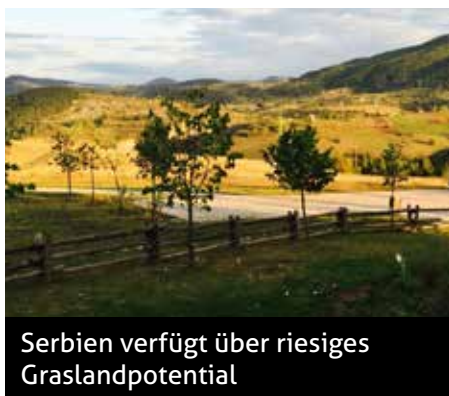
Serbien verfügt über riesiges Graslandpotential